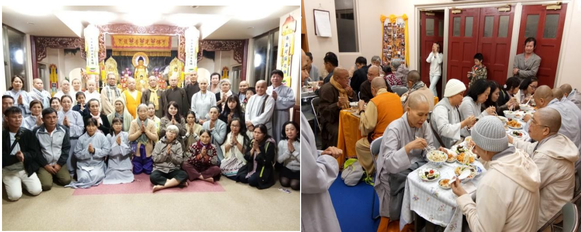
Chánh điện và trai đường Chùa Việt Nam, Tokyo