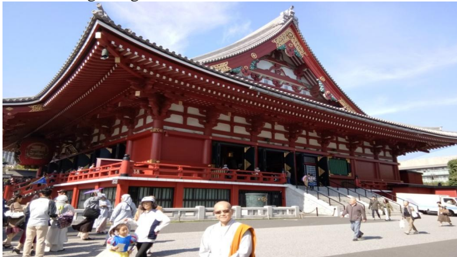
Tác giả ở ngôi chùa Quan Âm Asakusa, Tokyo