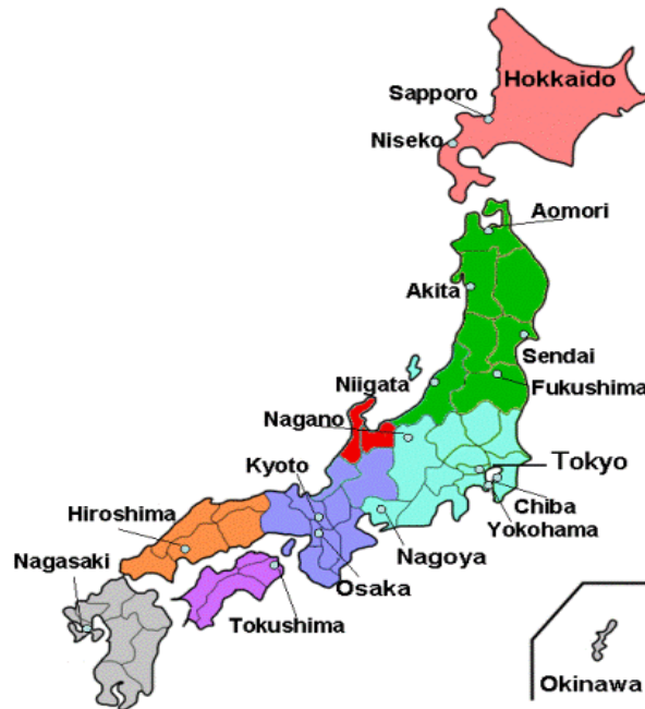
Bản đồ Nhật Bản (google)

Nhật Bản là một nước phát triển với mức sống và Chỉ số phát triển con người rất cao, trong đó người dân được hưởng tuổi thọ cao nhất thế giới, đứng hạng ba trong số những quốc gia có tỉ lệ tử vong ở trẻ sơ sinh thấp nhất thế giới, và vinh dự có số người đoạt giải Nobel nhiều nhất châu Á ( https://vi.wikipedia.org/wiki )