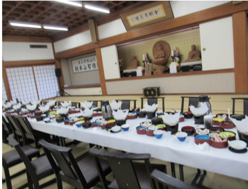
Nhà hàng Chisyakuin Ikkyuan

Viếng chùa Kinkakuji-Kim Các Tự , tức chùa Gác Vàng, là tên phổ thông của chùa Rokuon-ji ở Kyoto. Toàn bộ ngôi chùa, ngoại trừ tầng trệt, đều được bọc bằng những lá vàng nguyên chất, khiến cho ngôi chùa sáng rỡ và có giá trị vô cùng. Đây là ngôi chùa bậc nhất của Nhật Bản, là biểu tượng tinh thần, và đã từng là một Shiraiden (Đền Xá Lợi) di tích của Phật Giáo.