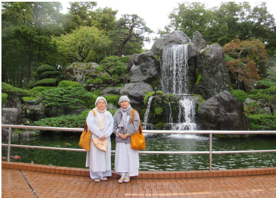
Suối đá non bộ rất đẹp phía trước khách sạn Fujinobo Kaen, Fuji San (NS Hạnh Quang-Ns Giới Hương)

như tranh vẽ hiện ra phía cuối đường: một hồ nước màu xanh ngọc bích ẩn hiện giữa vành cỏ xanh mượt, phía xa xa là bóng cây cổ thụ xòe tán rộng soi mình xuống hồ nước tĩnh lặng. Tới thăm nhanh gọn, chụp hình, rồi đi nhận phòng nghỉ đêm tại khách sạn Fujinobo Kaen o Hakonei/Fuji area, 495-201 Subashiri, Oyamacho, Sunto-gun. Ở khách sạn có phòng tắm Onsen, nước có chất lưu huỳnh tốt cho da, có hai phòng tắm lớn cho nam riêng và nữ riêng. Có phòng phục vụ chụp hình miễn phí mặc trang phục Kimono Nhật bản từ 6 giờ chiều đến 10g tối. Gối thơm huệ hương ở đây bán rẻ hơn trên núi Phú sĩ khoảng 300 Yen cho 1 gối, nhưng không có nhiều. Lên núi xa, nên bán mắc hơn. Đoàn dùng bữa tối buffee tại khách sạn.