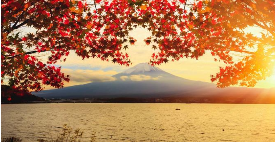
Núi Phú Sĩ giữa nắng thu lá vàng

Mùa thu là thời điểm nhiều du khách nhất (nghe nói ảnh hưởng bão ở Philippine nên kỳ này đoàn VN đi tháng 10 mà bị mưa dầm dề) vì vào mùa thu hàng loạt cây lá trên núi đều chuyển sang màu vàng hoặc đỏ đẹp một cách nên thơ và lãng mạn (giống như miền đông nước Mỹ). Thời tiết bắt đầu chuyển lạnh, trên đỉnh núi cũng xuất hiện tuyết trắng. Vào cuối tháng 10 lá nơi đây bắt đầu rụng, chỉ cần một cơn gió se lạnh mang hơi thở của thu cùng làm những tán cây đỏ, vàng này thì nhau bay xuống phủ kín cả lối đi, tô đậm thêm thanh cảnh lãng mạn nơi đây.