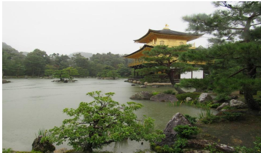
Chùa Kim Cát Thiên Lâm, Lộc Uyển Thiên Tự, Kyoto (chụp trong mưa - ngày 21/10/2017)

Viếng chùa Kinkakuji-Kim Các Tự , tức chùa Gác Vàng, là tên phổ thông của chùa Rokuon-ji ở Kyoto. Toàn bộ ngôi chùa, ngoại trừ tầng trệt, đều được bọc bằng những lá vàng nguyên chất, khiến cho ngôi chùa sáng rỡ và có giá trị vô cùng. Đây là ngôi chùa bậc nhất của Nhật Bản, là biểu tượng tinh thần, và đã từng là một Shiraiden (Đền Xá Lợi) di tích của Phật Giáo.