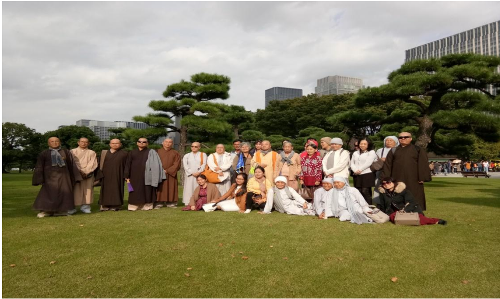
Sân cỏ trước Cung điện Hoàng gia Nhật Bản (Imperial Palace)

Chiều sau khi mua sắm đoàn tham quan Cung điện Hoàng gia Nhật Bản (imperial Palace) . Cung điện được xây dựng trên nền cũ của tòa thành cổ Edo, một vùng công viên rộng lớn được bao bọc bởi những hào nước và những bức tường thành ngay giữa trung tâm Tokyo. Vua và hoàng hậu ở dinh thự trên đồi rộng 7 hecta đất. Để giữ xanh mát cho hoàng cung, mỗi năm vua phải trả cho người làm vườn chăm sóc cây cảnh là 200 tỷ Yen Nhật Bản.