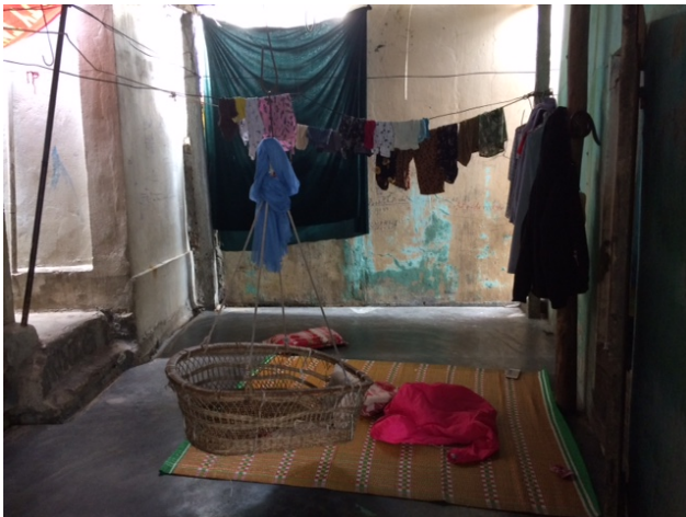
Chỗ treo nơi mẹ Đức giữ em bé kiếm thêm thu nhập