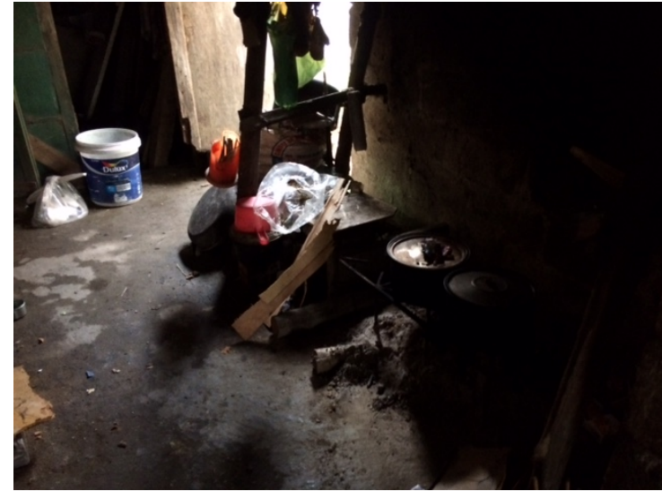
Bếp: nhà còn dùng bếp củi