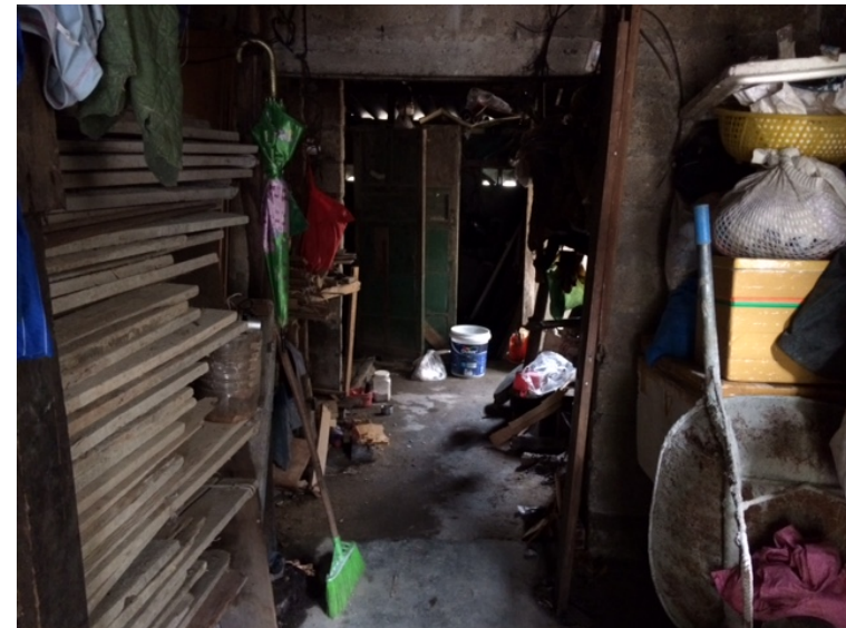
Lối vào nhà bếp