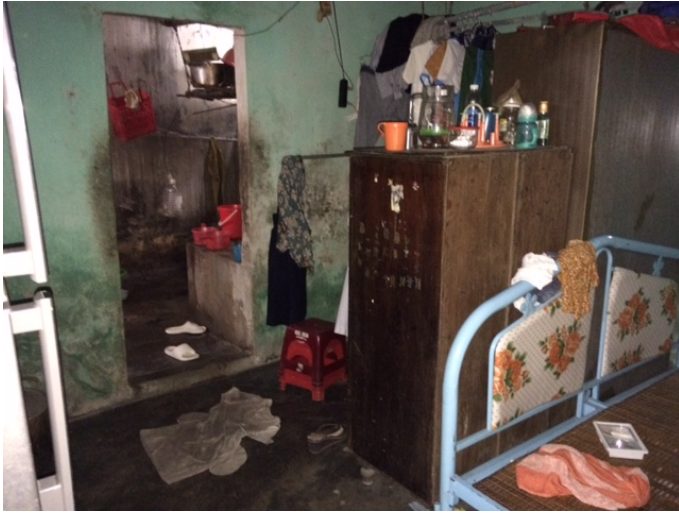
Chỗ sinh hoạt: ngủ, toilet