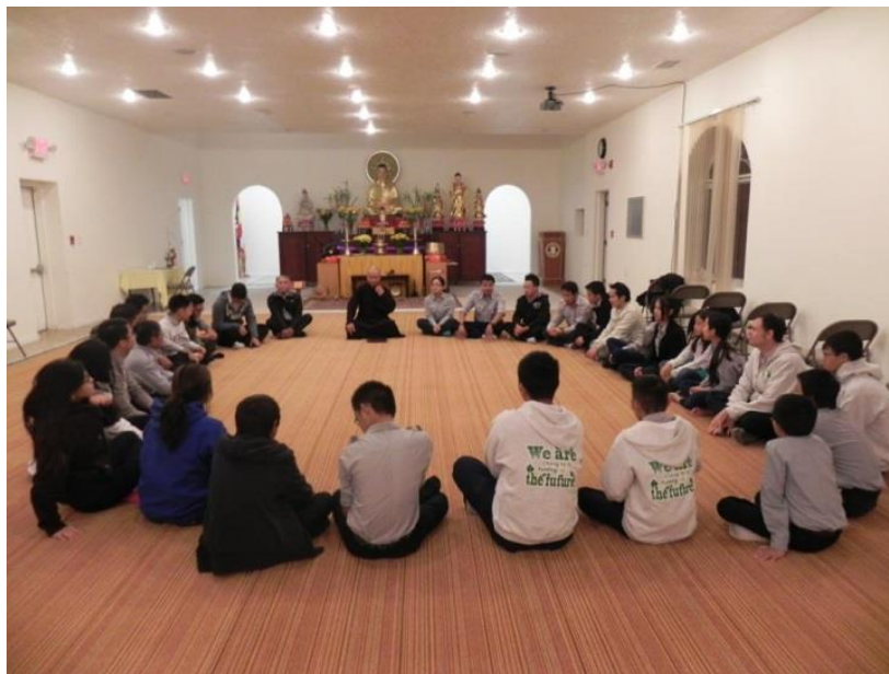
Đêm tâm tình cùng Thầy