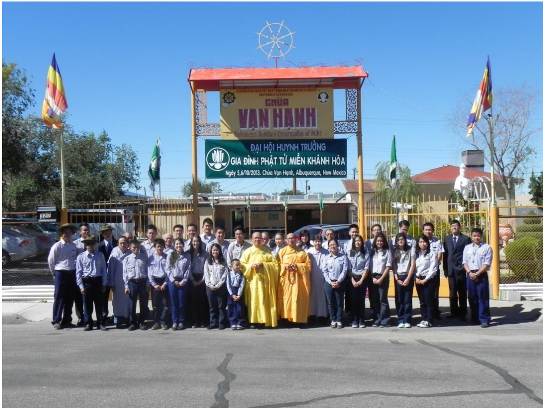
Đại Hội Huynh Trưởng GDPT Miền Khánh Hòa Tại Chùa Vạn Hạnh, Albuquerque, New Mexico - 2013