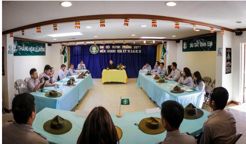
Quang cảnh Đại Hội Huynh Trưởng GDPT Miền Khánh Hòa Kỳ VI