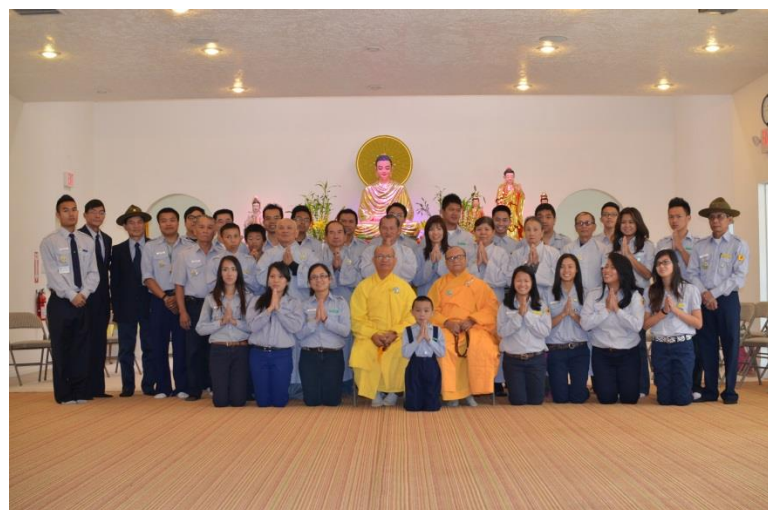
Chánh điện chùa Vạn Hạnh, New Mexico