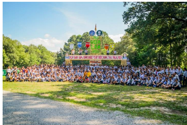
Trại Họa Bạn Hoa Lam