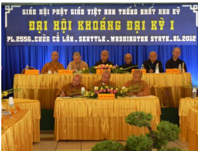
Đại Hội Khoáng Đại Giáo Hội PGVN Thống Nhất Hoa Kỳ