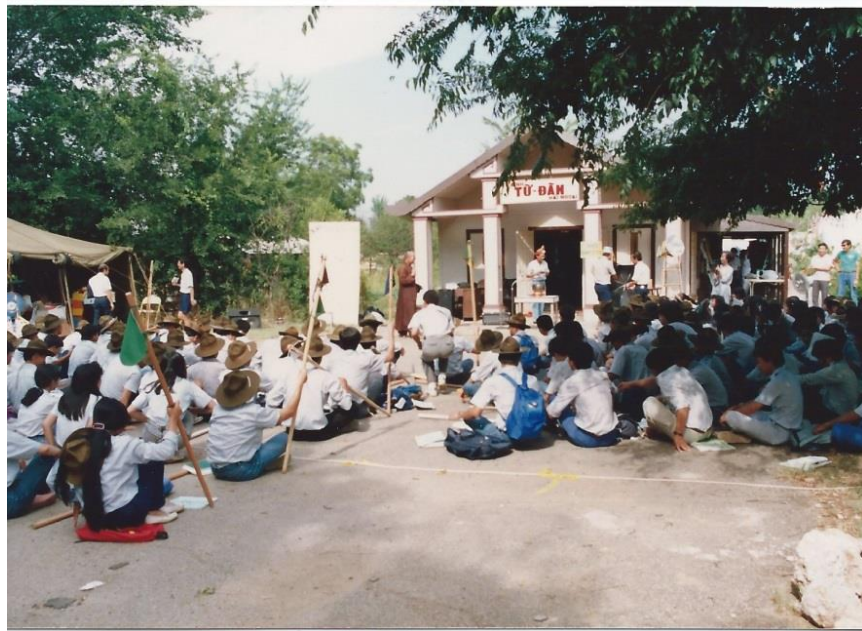
Một khóa học của Trại Huấn Luyện Lộc Uyển - A Dục 1988