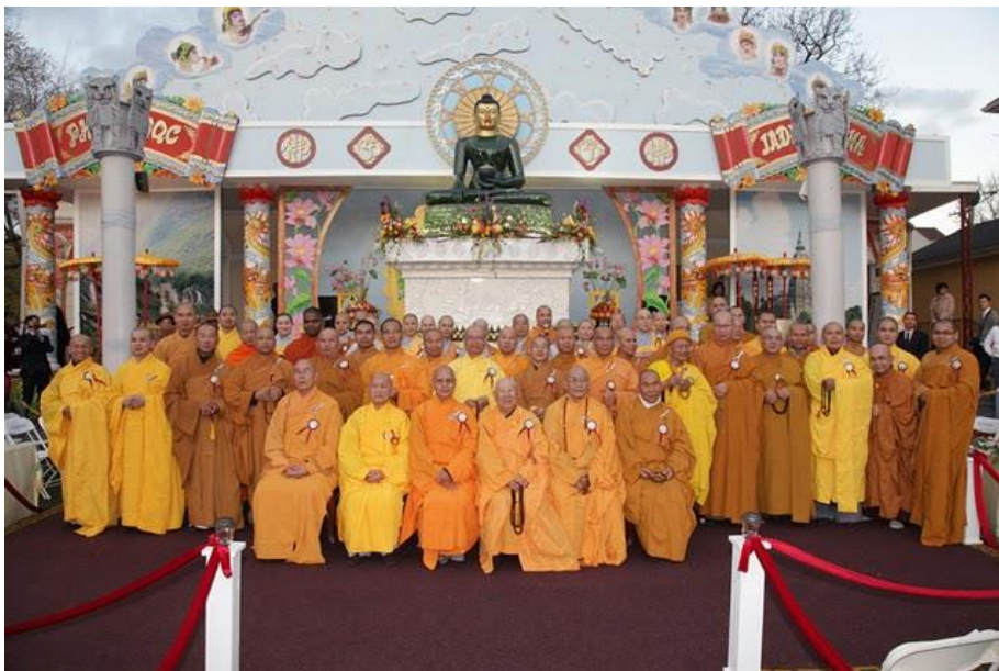
Phật Ngọc tại Trúc Lâm mà con là người phụ trách lộ trình Phật Ngọc

Ngoài những sinh hoạt của Miền Khánh Hòa sau này, Thầy và con còn gặp nhau rất nhiều qua những sinh hoạt của GDPT hay trên điện thoại với những hoài bão cho Tổ Chức GDPTVN Tại Hoa Kỳ, Nhưng thật sự Thầy và con chỉ có Một đề tài mà thôi! đó là GDPT mà nói hoài không hết.... Thầy đặt nặng việc kết hợp, thầy quan tâm đến Trại Trường GDPTVN tại Wills Point, Texas, thầy xem tất cả giấy tờ, bản vẽ và Thầy đã đề bạt rất nhiều ý kiến. Rồi Thầy lại khoe miếng đất của Thầy vừa mới mua để làm Tu Viện hay Trại Trường (Khi khóa tu là Tu Viện, khi cắm trại là Trại trường). rồi Thầy mơ ước và đã thành dự thảo cho sự kết hợp qua hình thức Tu Học Chung, Trại Chung và đặc biệt là “LỄ HỘI GDPTVN Tại Hoa Kỳ” tổ chức 1 tuần lễ tại Miền Nam California. Tấm lòng của thầy rộng lớn quá! Có thể nói là Thầy đã dành trọn đời cho Gia Đình Phật Tử Việt Nam