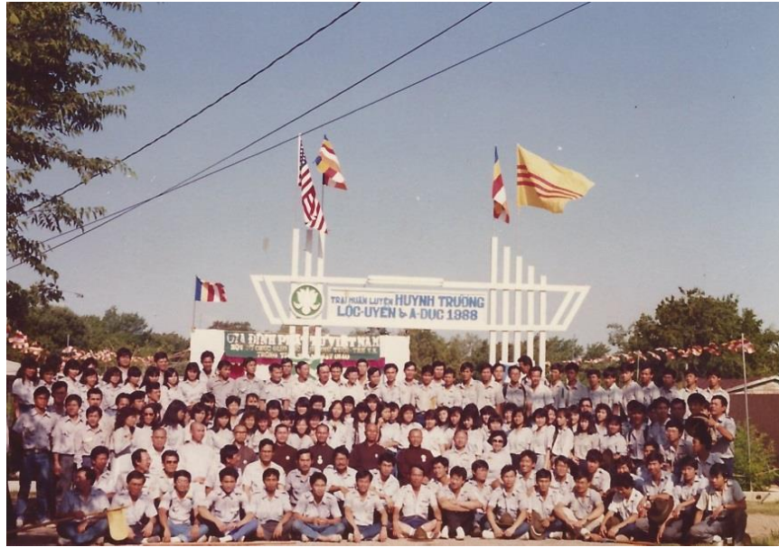
Liên Trại Huấn Luyện Lộc Uyển - A Dục tại Tổ Đình Từ Đàm, Dallas 1988