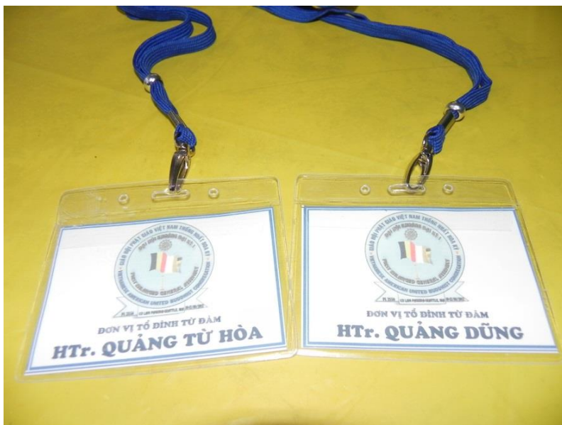
Đại biểu Tổ Đình Từ Đàm