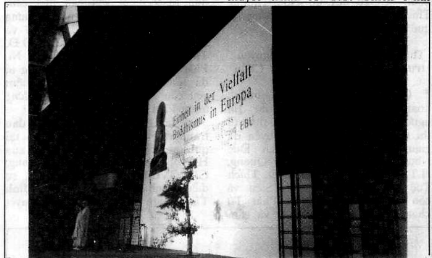
Tiêu đề của Đại Hội Phật Giáo Âu Châu : "Thống nhất nhiều mặt Phật Giáo tại Âu Châu"

đến vấn đề kỹ thuật và Tôn Giáo, nhất là việc thực hiện Expo năm