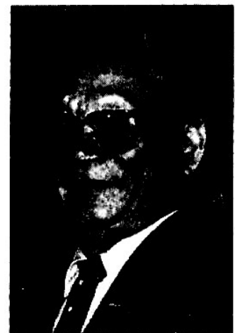
"Lê Đức Anh Tổng Thống CHXHCNN Việt Nam

* Tân quốc hội bù nhìn của bạo quyền CSVN đã họp phiên họp đầu tiên trong tháng 9 vừa qua. Đúng như các bài nhận định và phân tích thời sự của Viên Giác trong nhiều số báo trước đây, Lê Đức Anh nhân vật thứ 2 trong bộ chính trị, được bầu vào chức vụ Tổng Thống, Lê Đức Anh 72 tuổi cựu tổng trưởng quốc phòng, người được coi là thuộc khuyển hướng bảo thủ trong đảng CSVN, Lê Đức Anh cũng được coi là người thế lực nhất hiện nay trong đảng. Ngoài ra Nông Đức Mạnh 51 tuổi ủy viên bộ chính trị người sắc tộc thiểu số được bầu làm chủ tịch quốc hội. Võ Văn Kiệt vẫn được tin nhiệm trong chức vụ Thủ Tướng. Với màn bầu bán mới