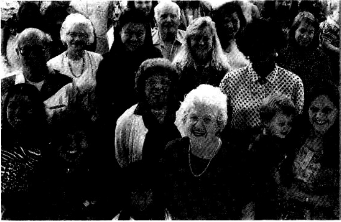
Ước mơ của con người là được nối vòng tay lớn sống chung hòa bình

Nói tóm lại, thế giới ngày nay gồm có những cuộc đấu tranh bất tận để tranh giành ảnh hưởng và quyền lực giữa các quốc gia, giữa da trắng và da màu, giữa các tôn giáo, giữa thể chế chính trị này và chế độ nọ v.v.. và v.v.. Lấy súng đạn làm phương tiện để giải quyết bất công các cuộc tranh chấp nên mới gây ra chiến tranh và thù hận. Nhưng hận thù không xóa bỏ được bằng thù hận mà chỉ có tình thương mới xóa bỏ được hận thù.