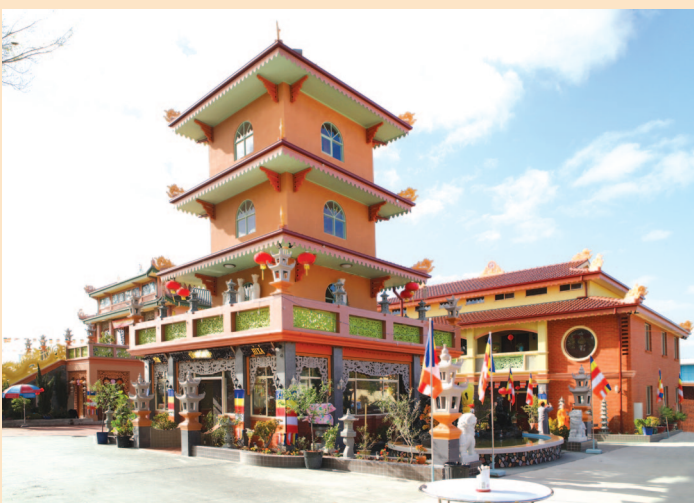
Bảo tháp Tứ Ân Benefactor Stupa 四恩寶塔 四恩寶塔