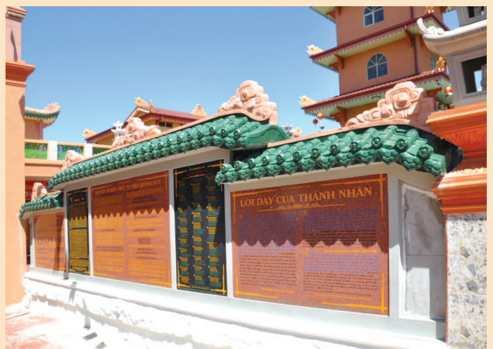
Bia giới thiệu tu viện History of the Monastery on a stone tablet 修院史碑 沿革紀念碑