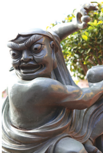
Tượng A La Hán Statue of Arhat 羅漢像 阿羅漢像